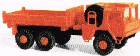
203 MAN Kipper 7t