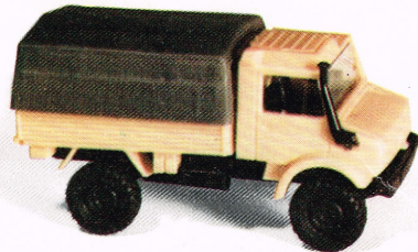
206 DB-UNIMOG 1300 Lkw 2t