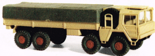
204 MAN Lkw 10t