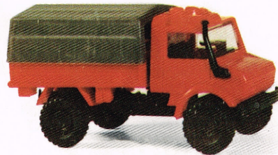
214 DB-UNIMOG 1300, Feuerwehr