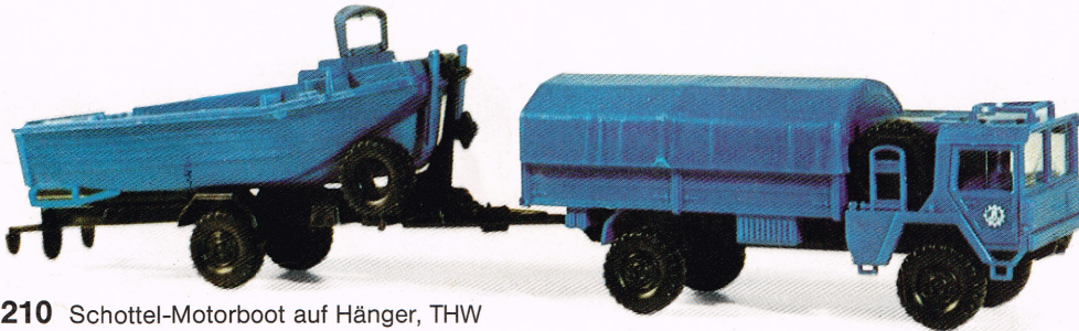
210 Schottel-Motorboot auf Hänger, THW