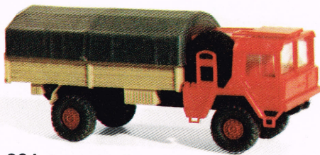
201 MAN Lkw 5t