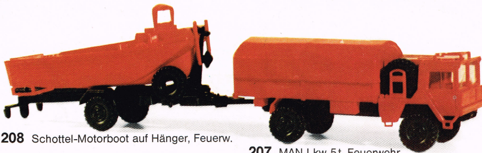
208 Schottel-Motorboot auf Hänger, Feuerw.