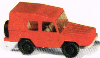
205 VW Iltis, Feuerwehr