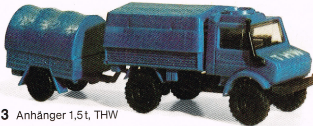
213 Anhänger 1,5t, THW